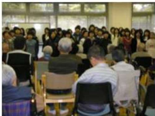
市内小学生との交流会