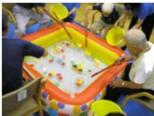
金魚すくいゲーム