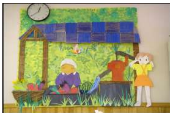
利用者さんと一緒に作成した壁画